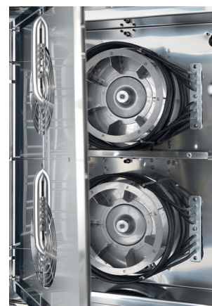
Apertura de panel de turbinas