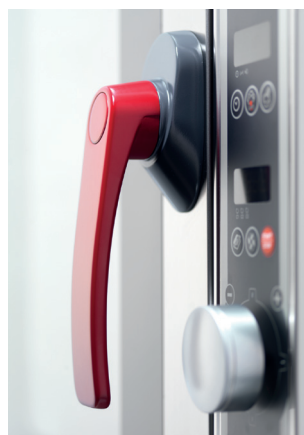
Cierre de seguridad